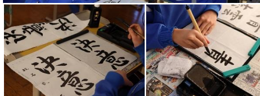
書き初め大会開催