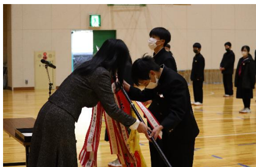
北杜ロータリークラブ中学生招待野球大会パート優勝 優勝旗届く! 始業式前に行われた、表彰伝達式にて披露しました。